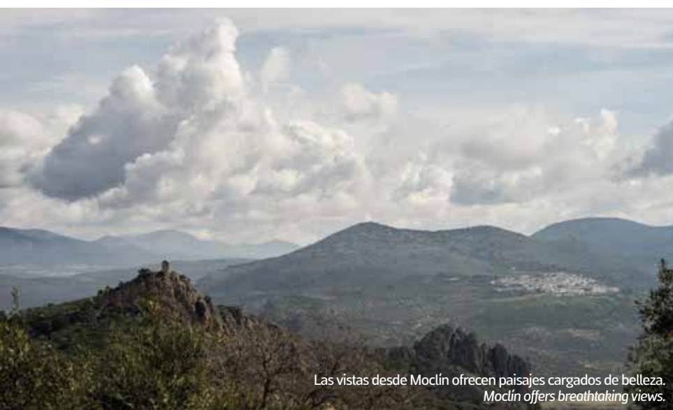
Las vistas desde Moclín ofrecen paisajes cargados de belleza. Moclín offers breathtaking views.