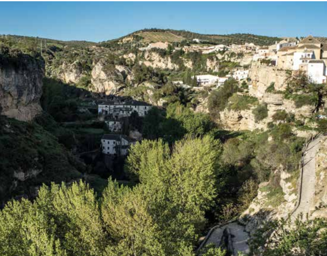
Catedral de Guadix (arriba) principal población del Marquesado y Los Tajos de Alhama de Granada, en El Poniente granadido. Catedral de Guadix (on top) is the biggest town in Granada's western El Marquesado and Los Tajos de Alhama de Granada districts.

This journey can be carried out in a long day. If you do it in three, you'll enjoy it. If you spend four to five days in the region, you'll fall in love with it. The perfect way to discover Granada's greatness and beauty – although you would need a whole life for that –. A trip which will make you fondly remember this Andalusian region for the rest of your life.