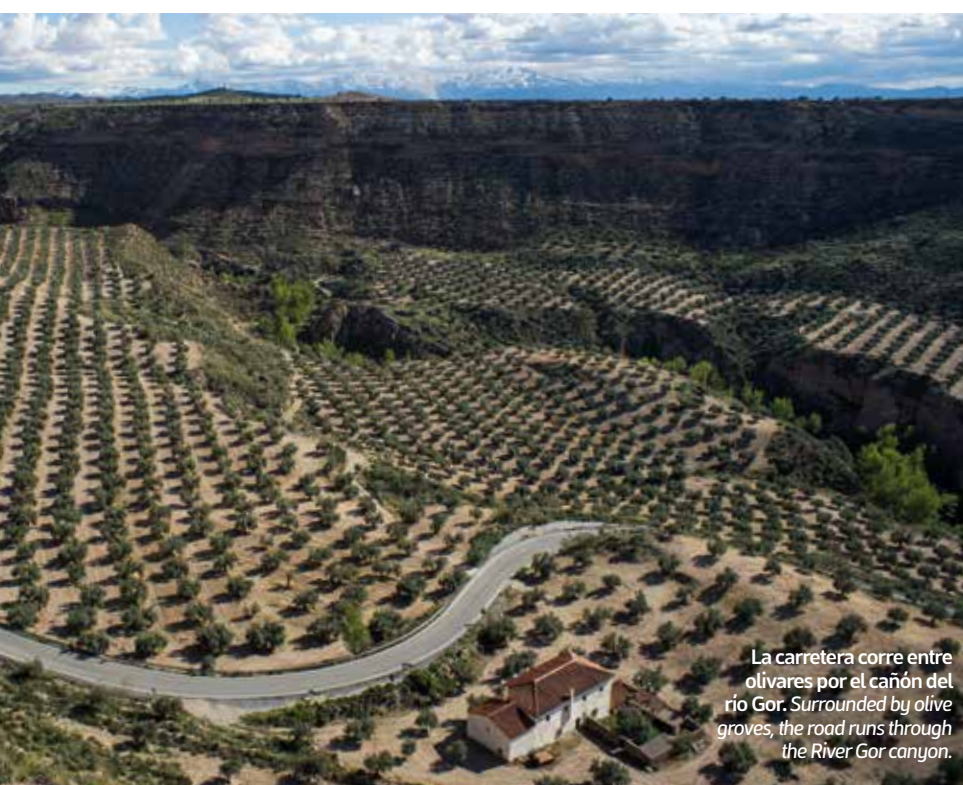
La carretera corre entre olivares por el cañón del río Gor. Surrounded by olive groves, the road runs through the River Gor canyon.

After picking up a car at the Granada-Jaén Federico García Lorca Airport, we set out north. The road will soon introduce us to a wonderful green, mountainous landscape: olive grove-covered slopes grown in impossible angles, plains filled with cereal crops and a winding road running down the steep terrain. The first stop of the journey will soon be in front of our eyes: Moclín. This white house town extends over the slope of a hill with an ancient Arabian castle on top of it. An urban planning shared by most of the region's western towns which tells us about Granada's military past.