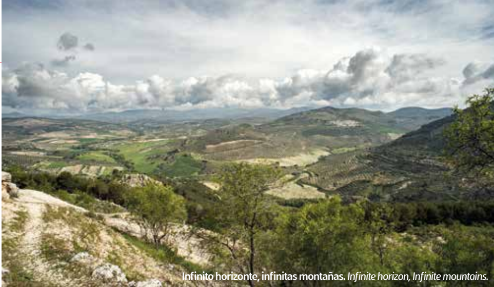
Infinito horizonte, infinitas montañas. Infinite horizon, Infinite mountains.