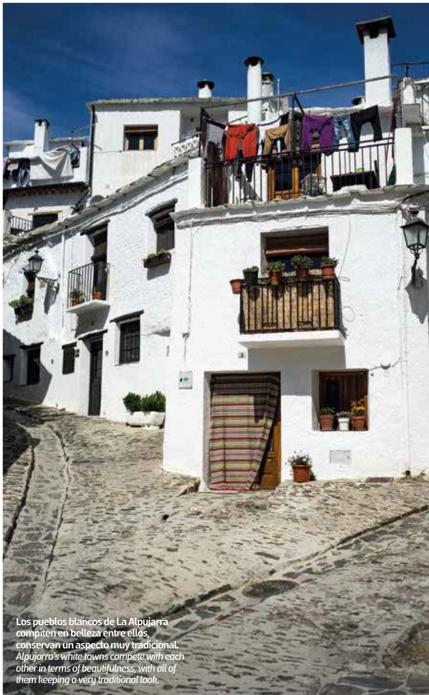
Los pueblos blancos de La Alpujarra compiten en belleza entre ellos, conservan un aspecto muy tradicional. Alpujarra's white towns compete with each other in terms of beautifulness, with all of them keeping a very traditional look.

En esta comarca el agua también está muy presente. El balneario, con sabor a otro tiempo y en un emplazamiento cuidado con esmero, lo encontraremos en Alicún de las Torres. De allí nos dirigimos a Guadix, población de cierta entidad y que bien merece una visita más pausada: catedral, teatro romano y por encima de todo ello la alcazaba árabe. Más arriba aún, dominando toda la ciudad y con unas vistas extraordinarias, el barrio troglodita, formado por casas-cueva horadadas por la mano del hombre en cerros y colinas. Este podría ser el final de nuestro viaje, pero como despedida, y ya ca-